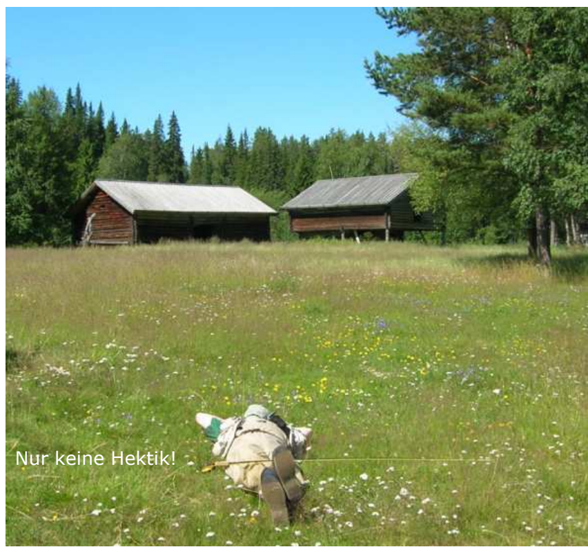
Nur keine Hektik!

Wir erreichen eine knietiefe Rinne, die in einem weiten Bogen enorm schnelles Wasser in die Hauptströmung führt. An deren Auslauf muss einfach Fisch stehen, denn das sauerstoffreiche Wasser bietet bei einer Lufttemperatur von 29° C ideale Bedingungen