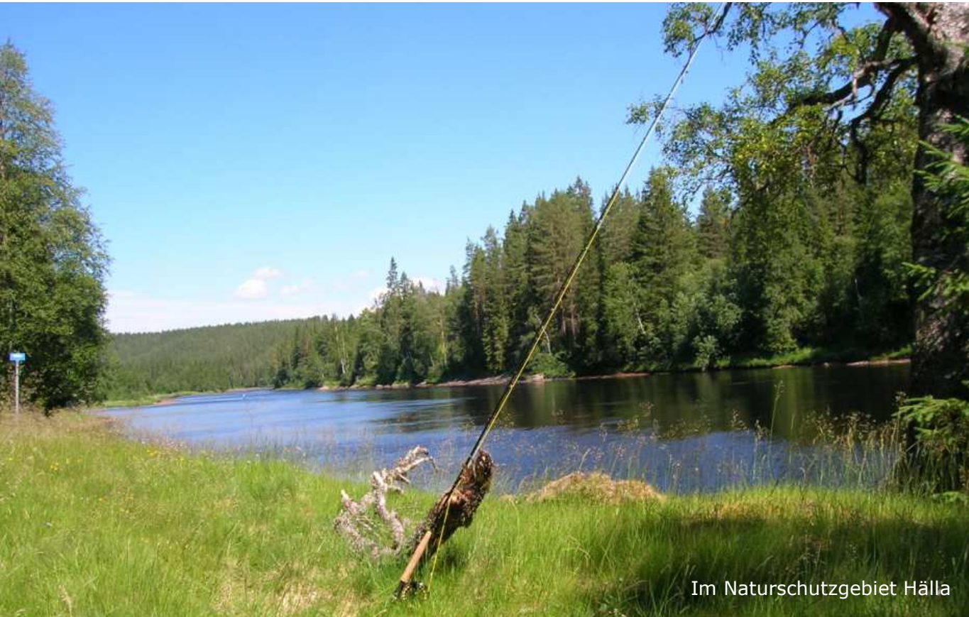
Im Naturschutzgebiet Hälla

eventuelle Standplätze nicht zu beunruhigen. Auch müssen wir uns so nicht durch das hohe Ufergras kämpfen – wer weiß schon, wer sich dort