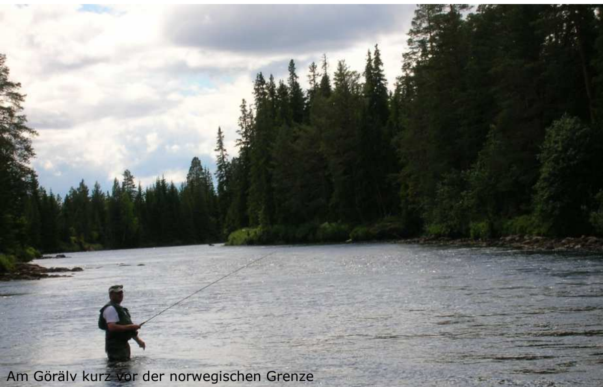
Am Görälv kurz vor der norwegischen Grenze

Unser nächstes Ziel ist der Västerdalälv. Von der Hauptstraße erreicht man bei