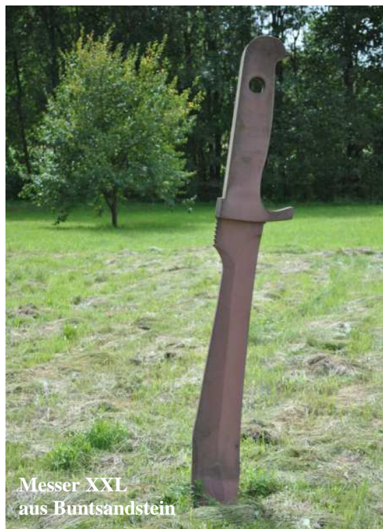
Messer XXL aus Buntsandstein

es spätabends voller Stolz vorgeführt - es sollte mehrere Wochen vergehen, bis die Wunde verheilt war.